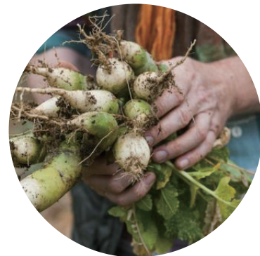
나의 텃밭을 가꾸며 하루를 엮니다.